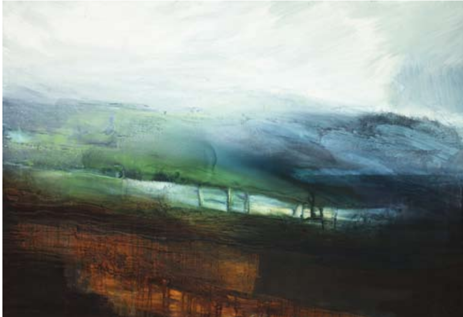
Els Geelen: Landskap i lysegrønn str. 140 x 95 cm